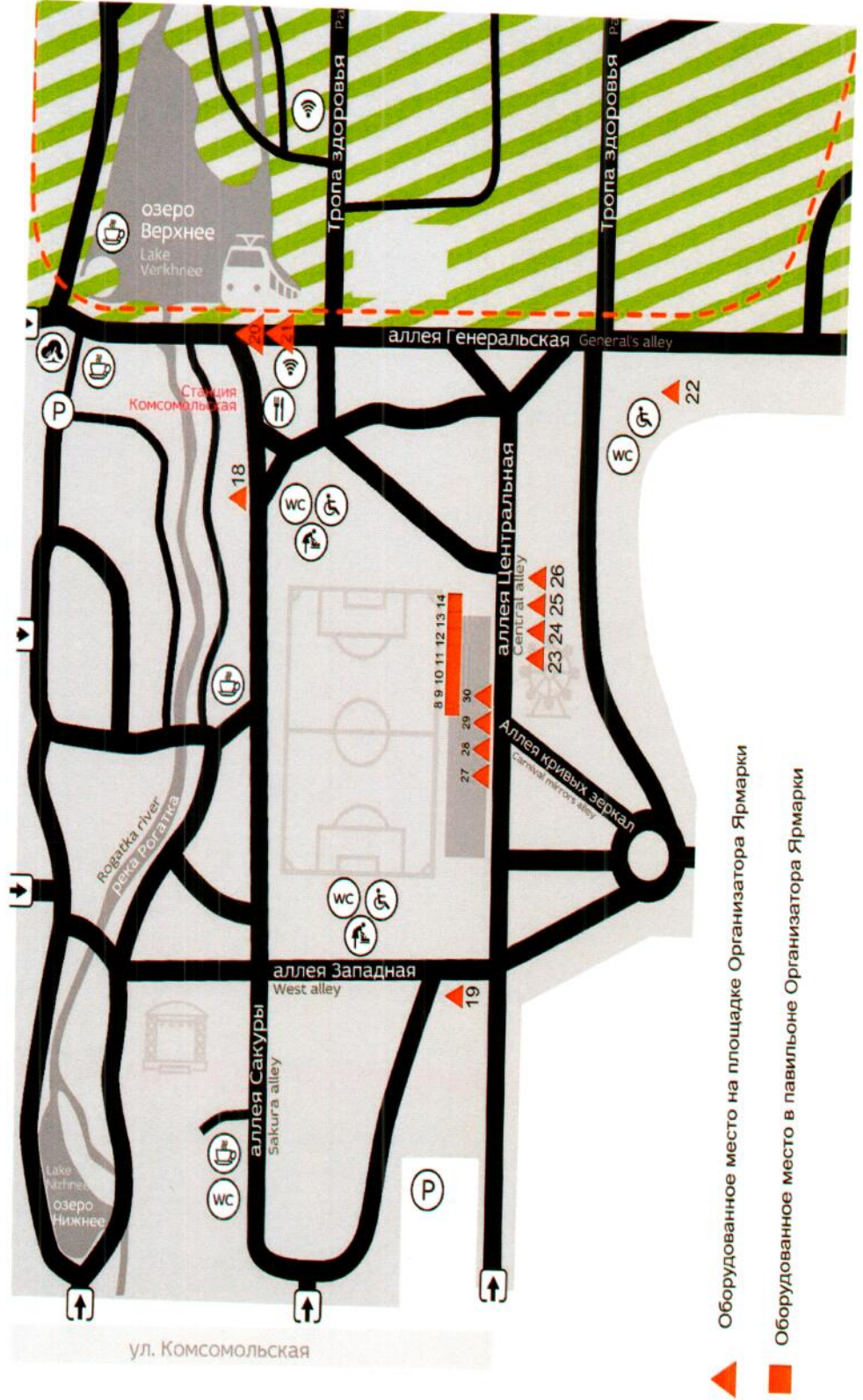
Схема размещения оборудованных мест Ярмарки на территории МАУ ГПКиО для № 8, 9, 10, 11, 12, 13, 14 с 01.05.22 по 31.10.2022, с 01.04.2023 по 31.10.2023, с 01.04.2024 по 31.10.2024, № 18, 19, 20, 21, 22, 23, 24, 25, 26, 27, 28, 29, 30 с 01.05.22 по 30.09.2022, с 25.04.2023 по 30.09.2023, с 25.04.2024 по 30.09.2024

Приложение № 9 к Порядку организации деятельности универсальной ярмарки на территории МАУ ГПКиО, утвержденному приказом директора МАУ ГПКиО от 14.07.2022 № 279-п